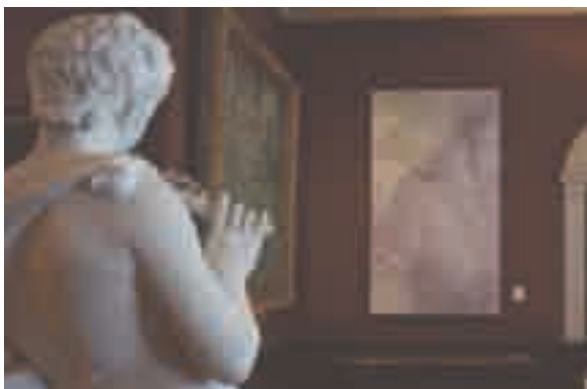
Agnès PEZEU Dream 2012 peinture glycéro sur photographie imprimée sur toile