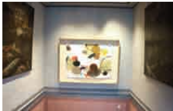
Saraswati GRAMICH Agglomération 1 2013 huile, graphite sur papier